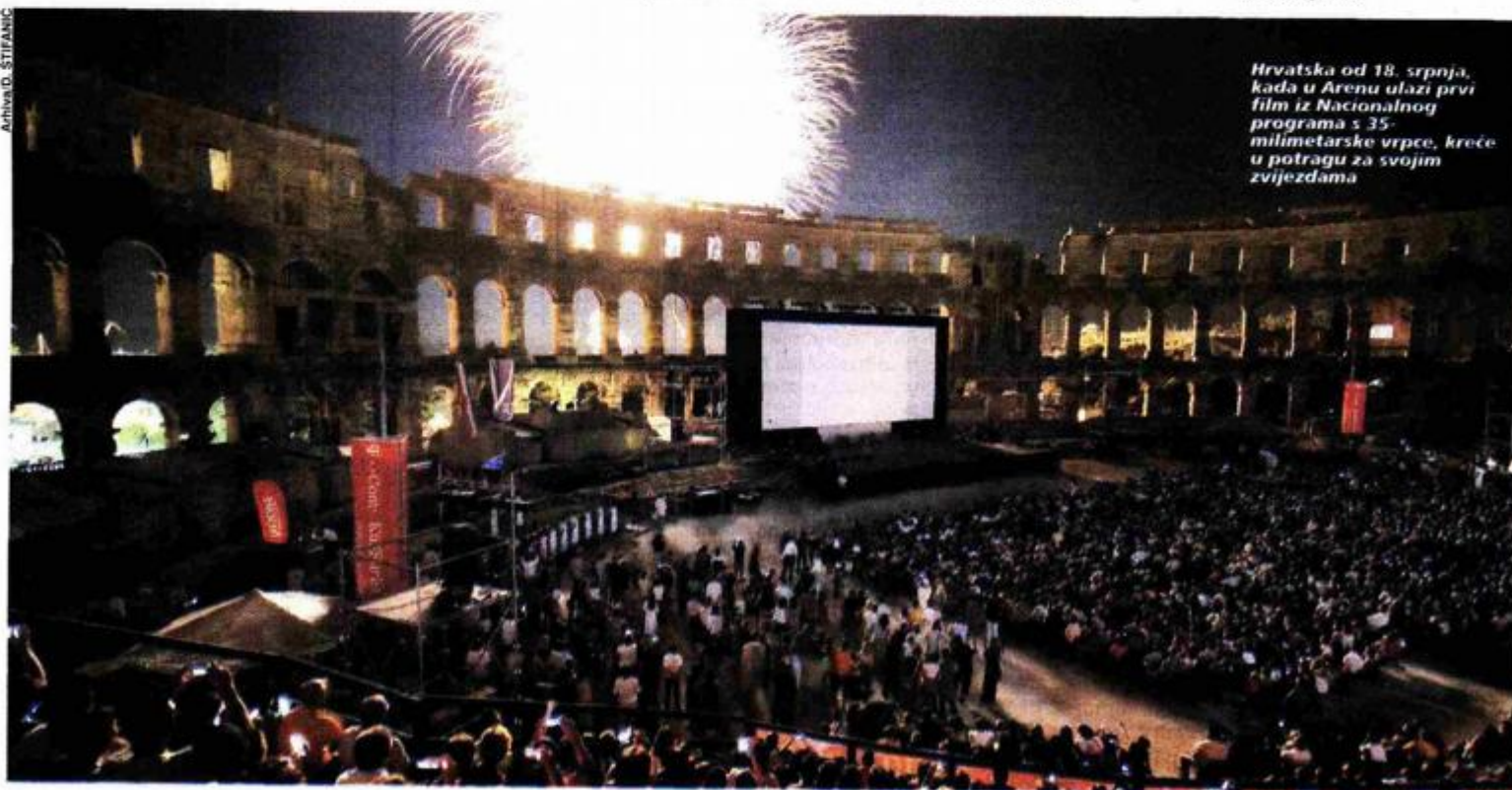
Hrvatska od 18. srpnja, kada u Arenu ulazi prvi film iz Nacionalnog programa s 35-milimetarske vrpce, kreće u potragu za svojim zvijezdama