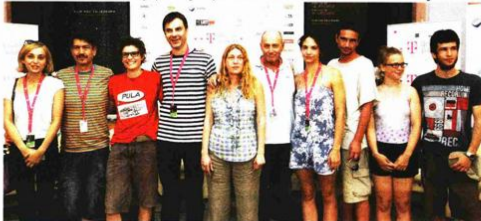
Dio ekipe omnibusa »Zagrebačke priče« na konferenciji za novinare

Za razliku od prvih »Zagrebačkih priča« s izrazitom socijalnom tematikom, ovaj put je prevladala intima obitelji unutar četiri zida