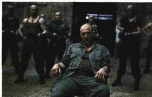
Ralph Fiennes kao Koriolan

– Koriolan je ekstremni lik, čovjek iznimne hrabrosti koji zatambljuje sve emocije koje mu na borilištu nisu korisne. S te strane kao psihopat – odlučan je u tome da bude uvijek on, da ne glumata i ne cjenka se s onim što ne želi. Glumiti tako ekstremno netolerantnog lika je pravi izazov dodamo li tome njegove snažne reakcije i bijes, te dijaloge koje je Shakespeare njemu namijenio. Koriolanov jezik je dinamičan i provokativan – to je kao da voziš »ferrari«. No sada mi je puna kapa ovakvih likova i rekao sam svom agentu da više ne želim glumiti te zlikovce, iako volim igrati u ulogama koje su moralno dvosmislene – kazao je Fiennes.