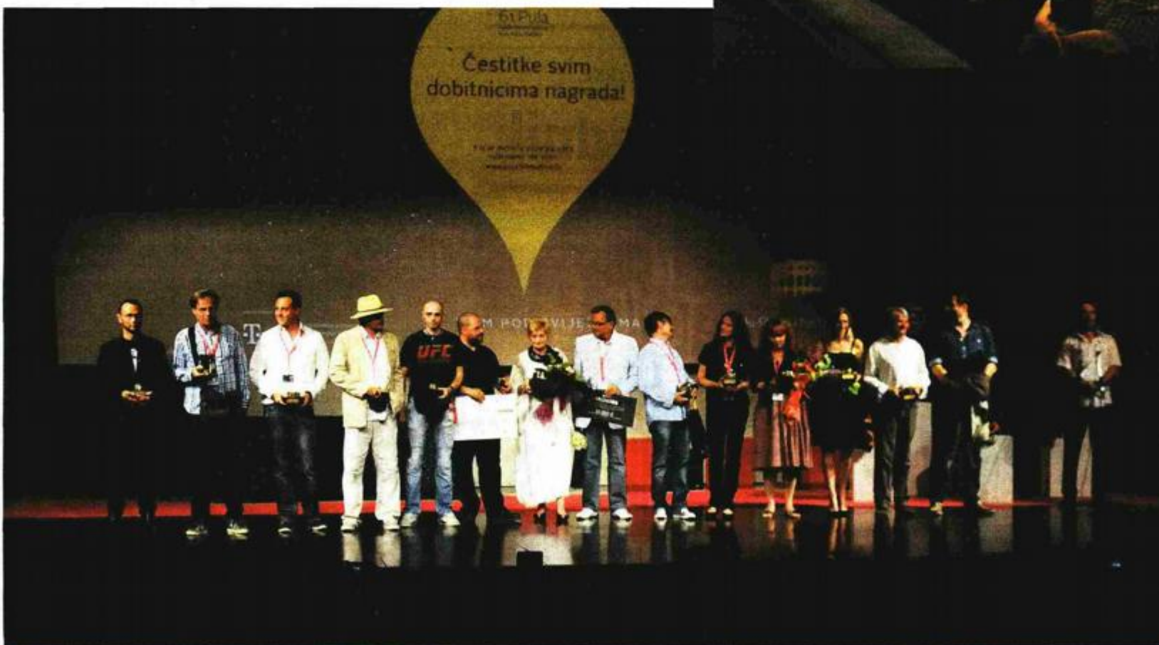
Dobitnici nagrada 61. Pule

gestivan portret čovjeka opterećenog zločinom iz prošlosti i samoćom. Uz zahvale žiriju i prisutnom redatelju Zvonimiru Juriću, pozvao je duhovito cijeli žiri na skori festival početkom rujna u njegovo Orašje, gdje ih čeka, kaže, pun stol.