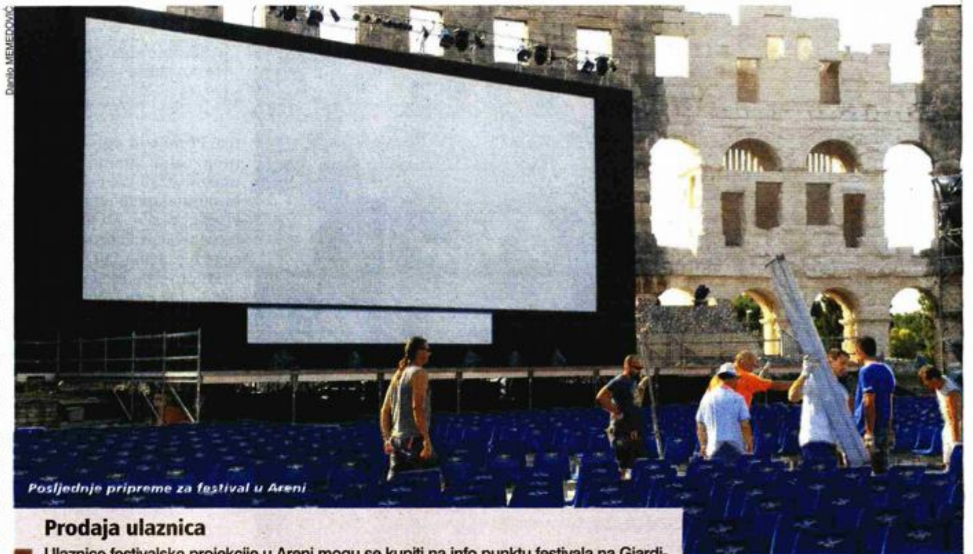
Posljednje pripreme za festival u Areni