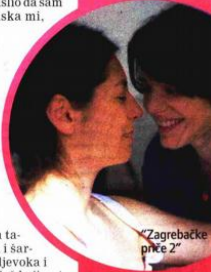
"Zagrebačke priče 2"