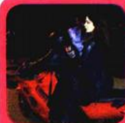
U filmovima: "Svinjari"

X Biste li voljeli da ste u Angelininu filmu "U zemlji krvi i meda" imali glavnu ulogu?