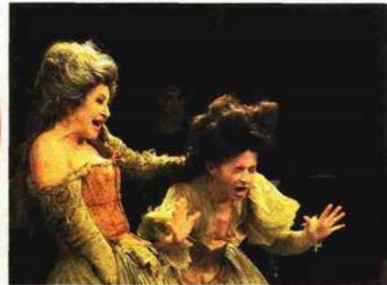
Predstava »Schneewittchen After Party«