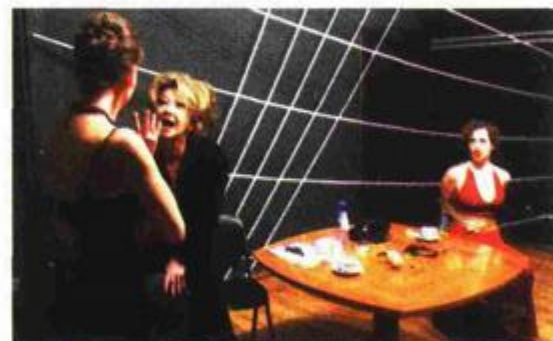
Predstava »Gospođice Rice, puno prije geopolitike bila je glazba«