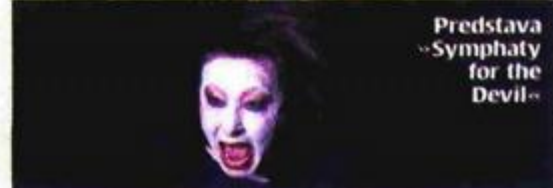
Predstava »Symphaty for the Devil«