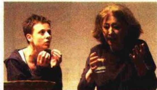
Predstava »Anna Weiss«