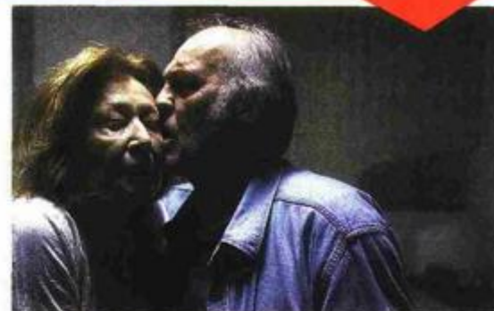
Film »Noćni brodovi«