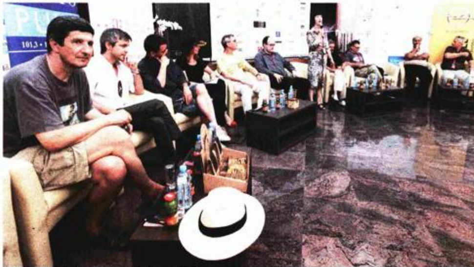
Ocjenjivački sudovi objavljuju rezultate