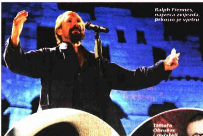
Ralph Fiennes, najveća zvijezda, prkosio je vjetru