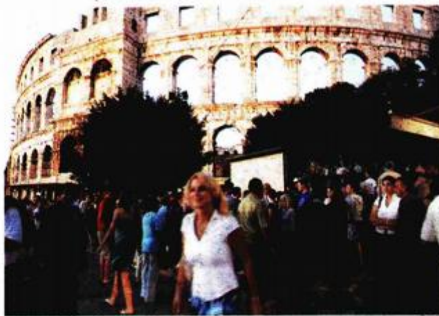
»Muving« pred početak projekcija - Arena u Pulj