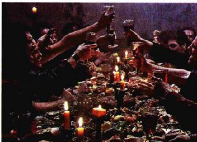
Iz filma »Penelopa«